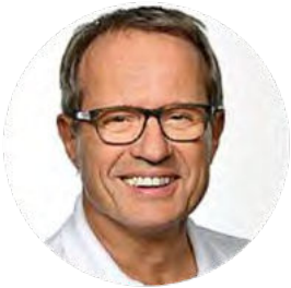
TIL SCHWEIGER Schauspieler